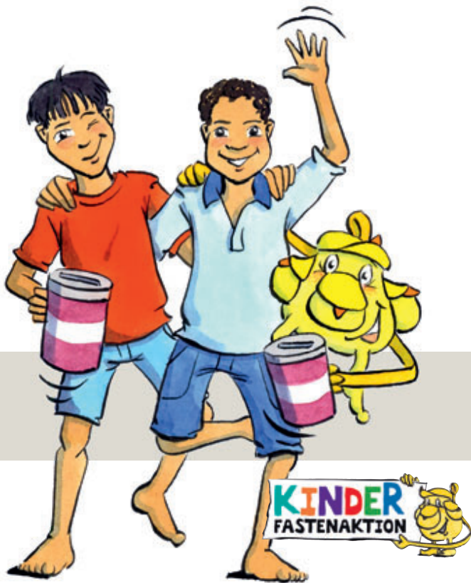
Illustration: Mele Brink